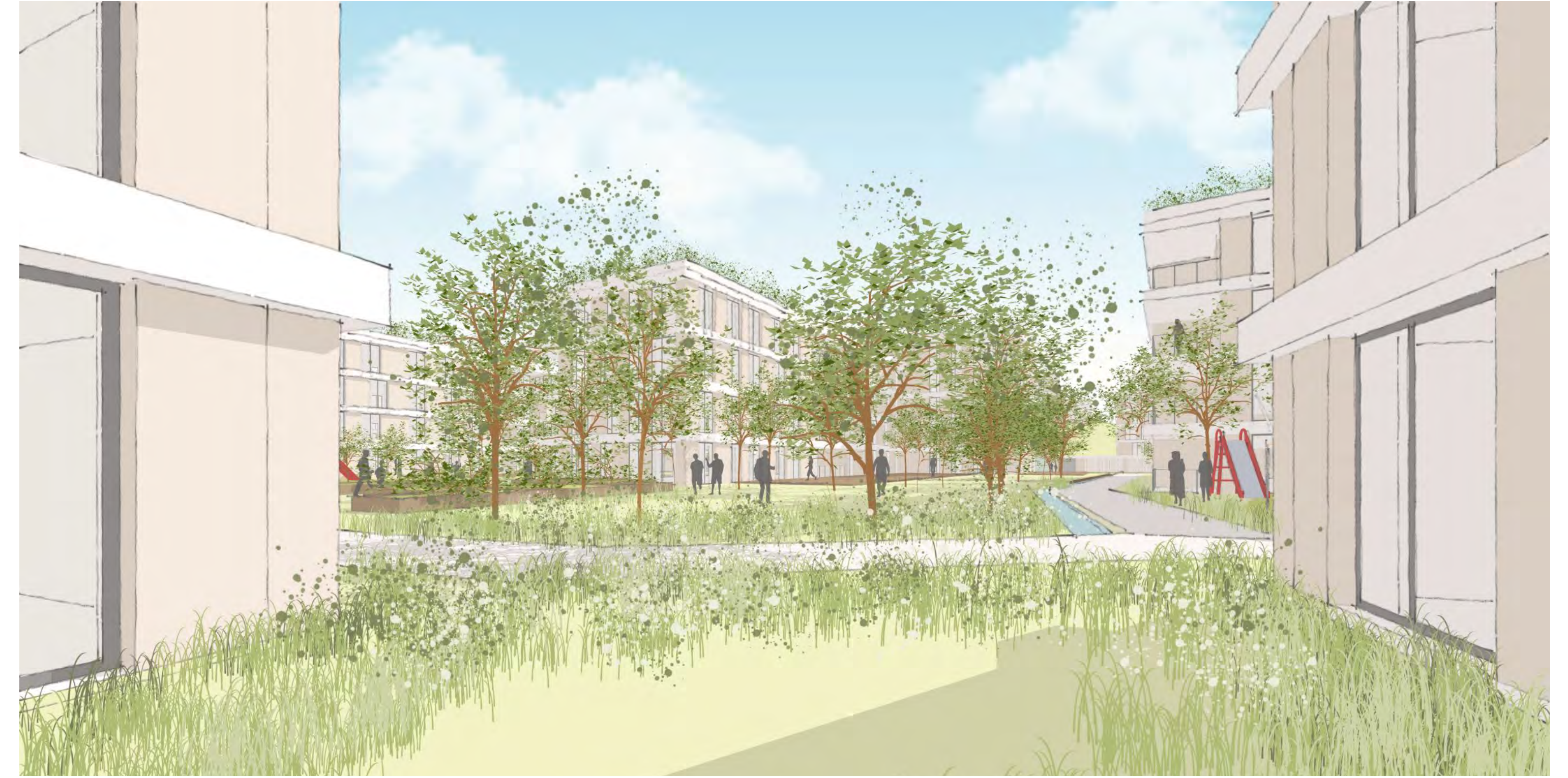
Blick in Richtung Gemeinschaftsgarten