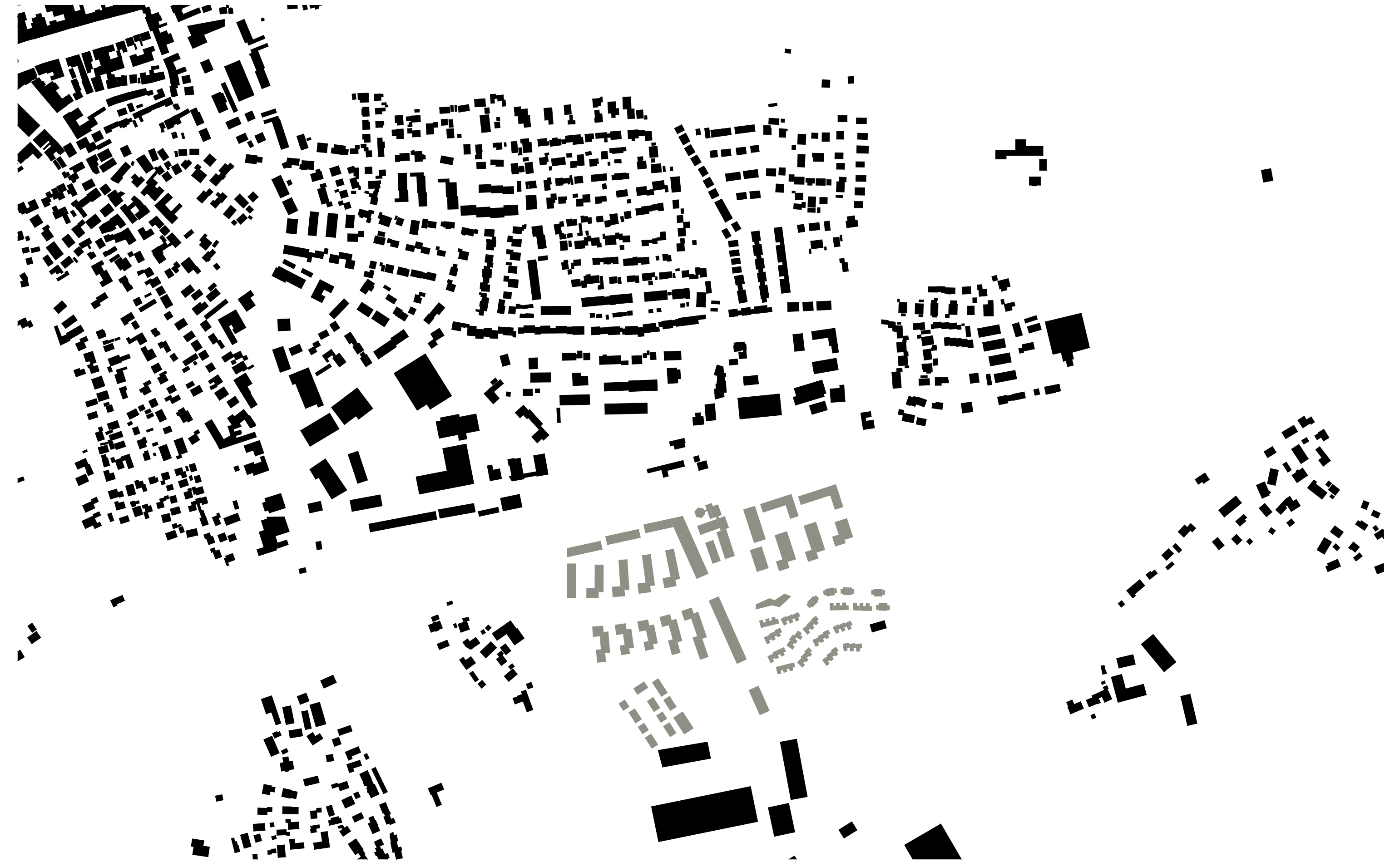
Schwarzplan (M 1:5000)