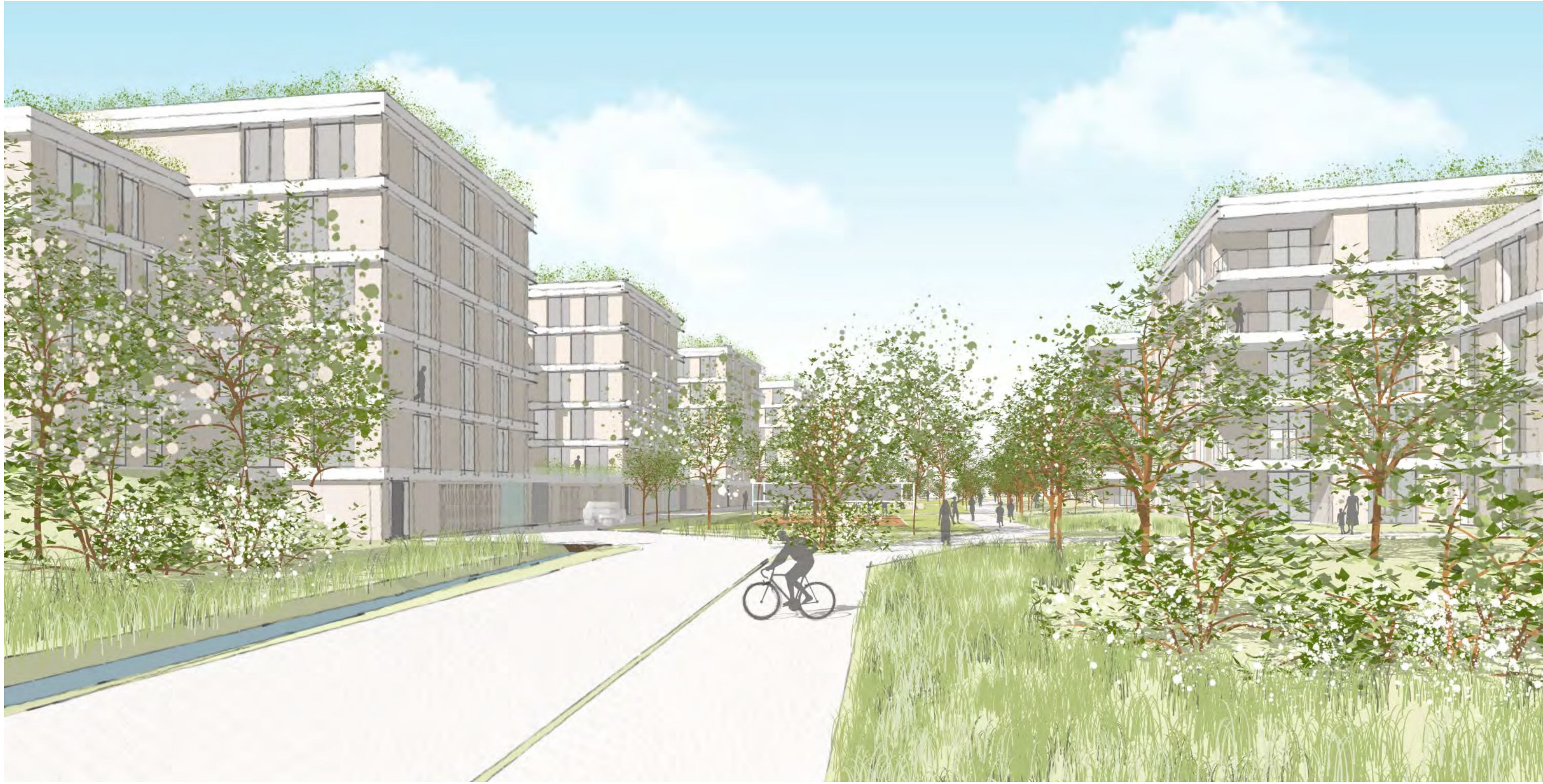
Blick vom zentralen Platz in Richtung Aufenthalt/ Bewegung/ Biodiversität