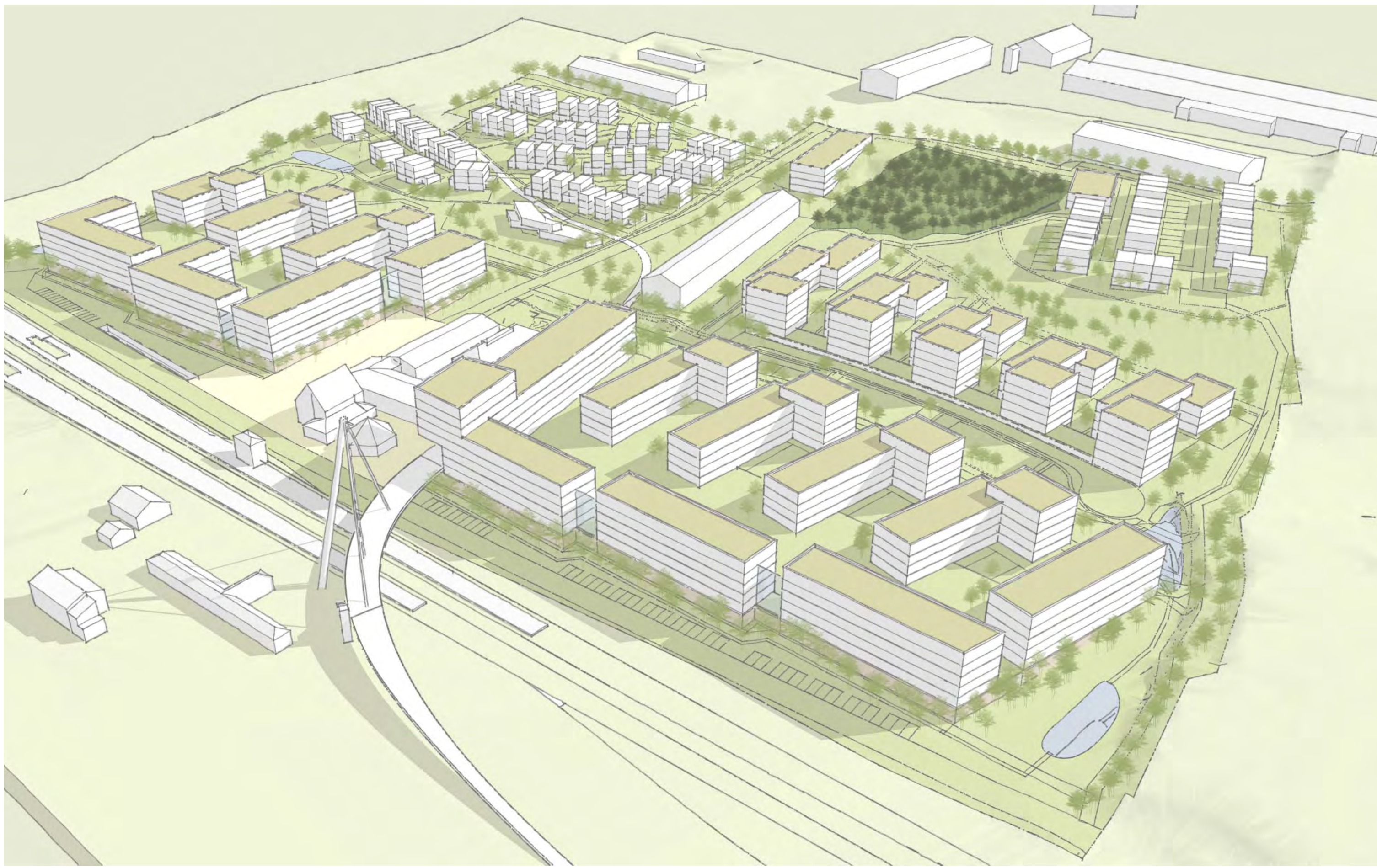
Blick über das neue Stadtquartier