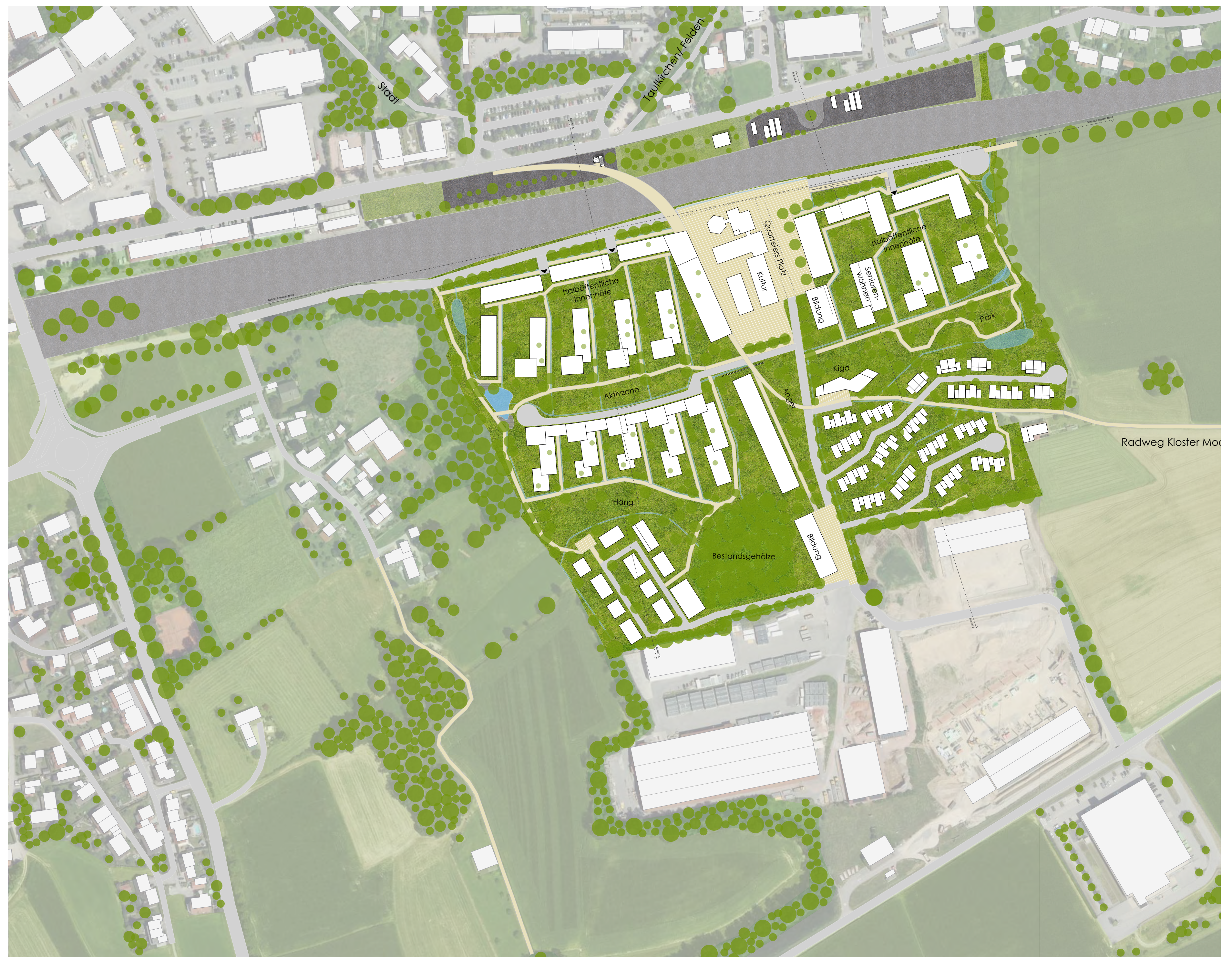
Strukturplan (M 1:2000)