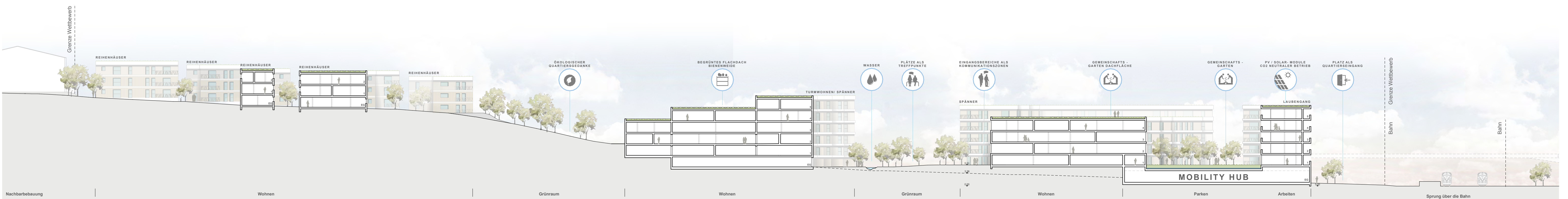
Schnitt A (M 1:500)